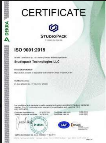
Сертификат качества ISO 9001:2015