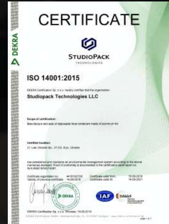
Сертификат качества ISO 14001:2015