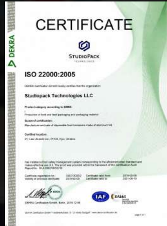
Сертификат качества ISO 22000:2005