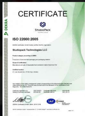
Сертифікат якості ISO 22000:2005