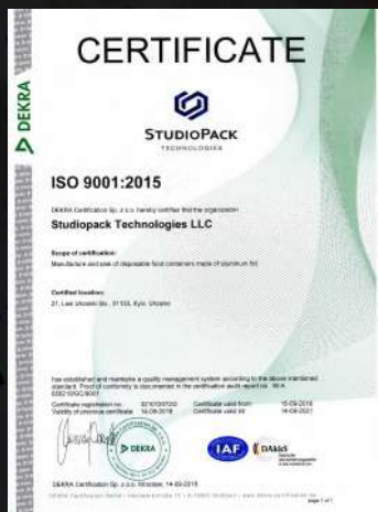
Сертифікат якості ISO 9001:2015