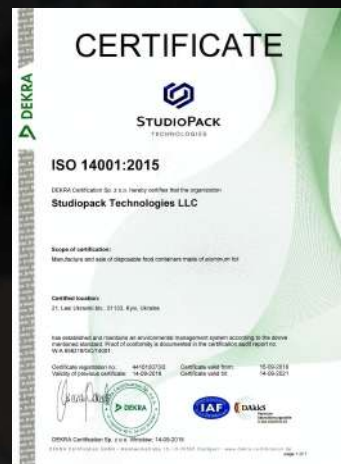
Сертифікат якості ISO 14001:2015